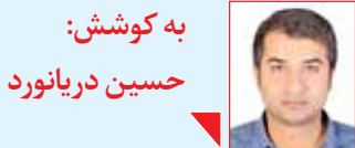
به کوشش: حسین دریانورد